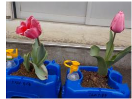
～1年生が育てているチューリップが咲きました～

学校の中庭には、1年生が一生涯懸命育ててきたチューリップが咲き始め、春の訪れを教えてくれています。そのような中、23日(水)の明日は、卒業式が挙行されます。在校生は、昨年度同様、密を避けるため卒業式には参加しませんが、6年生への「ありがとう」の気持ちと「門出」への祝福をこめて、一人一人のメッセージが体育館に貼られています。いよいよこの学び舎を6年生が巣立っていきます。