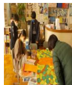
5年生の準備の様子

いよいよ5年生は、6年生からバトンを渡される時がやってきました。1～4年生に声かけをして6年生に感謝の気持ちを伝えようとリーダーシップを発揮している5年生はとても頼もしいです。すでに伝統のバトンを受け取った5年生のこれからの活躍が楽しみです。