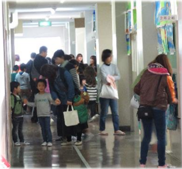
↑昨年度の学校へ行こう Day II より↓